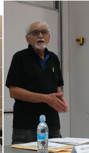
פרופ' דוד גילת