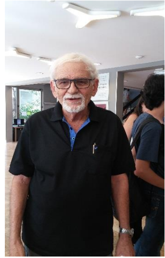
פרופ' דוד גילת