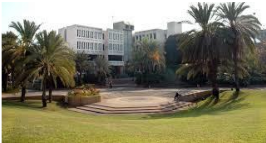
בית הספר מאחל לכולם קיץ נעים